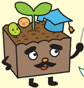
北海道クリーン農業イメージキャラクター ハタケダ博士&くりーんだね